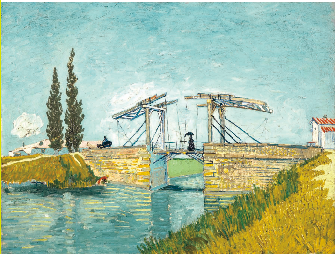
フィンセント・ファン・ゴッホ《跳ね橋》1888年 Vincent van Gogh, The Drawbridge , 1888 Wallraf-Richartz-Museum & Fondation Corboud, Cologne

Wallraf-Richartz-Museum & Fondation Corboud, Cologne, Germany