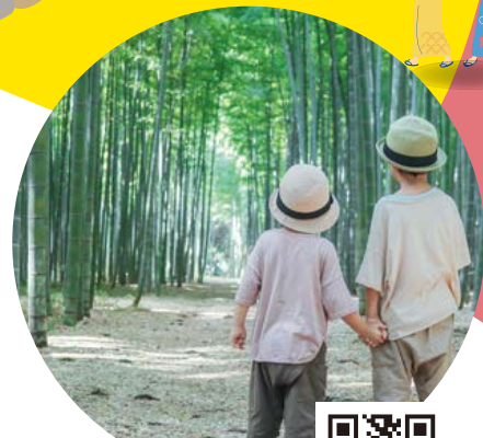
若竹の杜 若山農場

自然豊かな広大な敷地に、直売所やレストラン、温泉やプールに宿泊施設なども揃う滞在体験型の道の駅。各種体験や森遊び、ドッグラン利用など、過ごし方はさまざま。園内で醸造されるクラフトビールはお土産にもおすすめです。