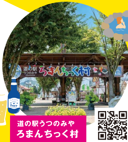
道の駅うつのみや ろまんちっく村

大谷石採掘に関する歴史と変遷をわかりやすく紹介し、あわせて採掘道具や運搬具などの資料も展示している。近隣にはカフェなど隣接し、一日楽しめちゃう♪