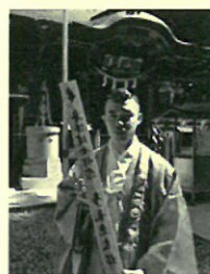
御壇木奉納五千円

※国道 293 号沿いの当山駐車場より無料シャトルバスが運行しておりますのでお車でお越しの際は、是非ご利用くださいますようお願い申し上げます。路上駐車などを行う場合は、事故などに関しましては当山では責任を負いかねますので交通規則、警備員の指示に従って下さいますようお願い申し上げます。